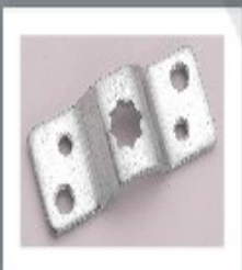
↳ Soporte S-10

Para el óptimo funcionamiento y durabilidad del motor tubular triton , es necesario usar solo accesorios originales triton .