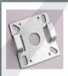
↳ Soporte S-20