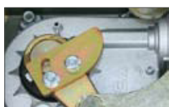
Stop meccanici regolabili in entrambe le direzioni.