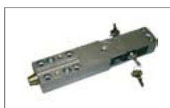
Sblocco Plus con leva e serratura di sicurezza.